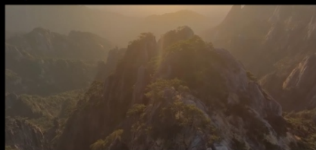
Горы Гуаньшань, Китай 10 м 11 с

Выберите видео и добавьте их в список воспроизведения.