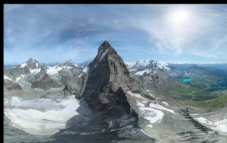
Гора Маттерхорн, Альпы 6 м 5 с